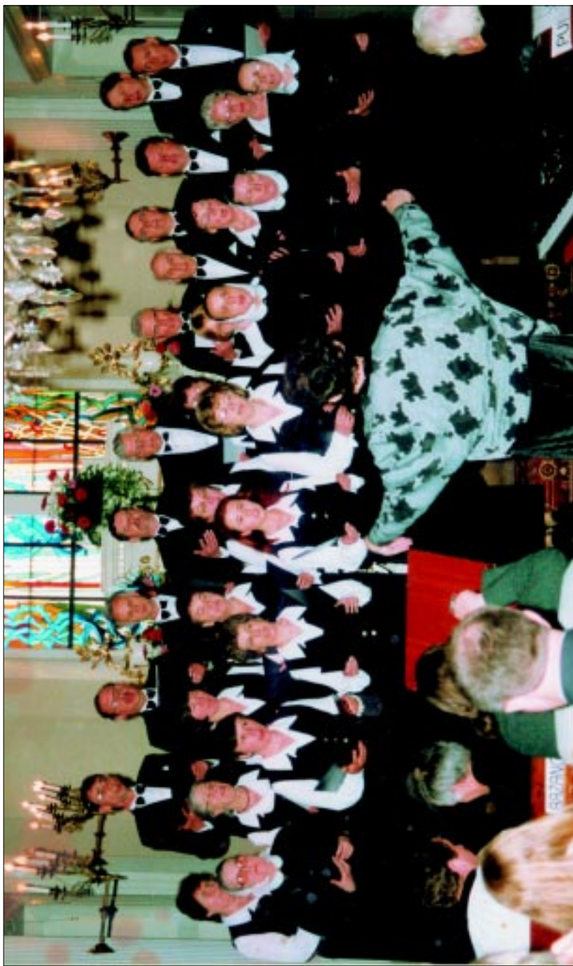
Na wiosennym Zjeździe Chórów Diec. Cieszyńskiej w Wisle Centrum - 26.04.1998 r.