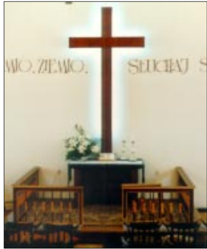
Ołtarz kaplicy „Eben-Ezer”