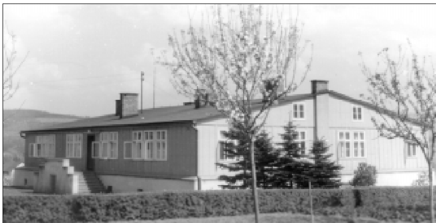
Drewniany barak służący jako Dom Macierzysty Diakonu