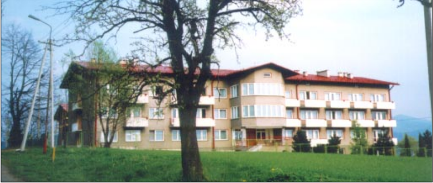
Dom Opieki „Emaus” w Dzięgielowie

Od 1982 roku chór regularnie, przynajmniej raz w roku bierze czynny udział, służąc pieśniami w czasie nabożeństw w Domu Opieki „Emaus”, który otwart został w październiku 1981 r. Chór uczestniczy także aktywnie w Zjazdach Chórów Diecezji