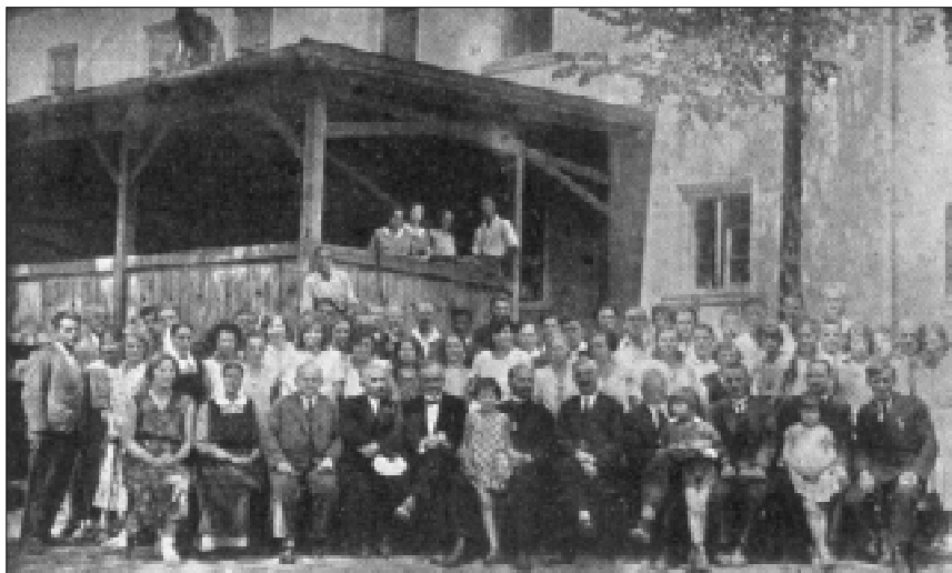
Uczestnicy kursu biblijnego w Zakładach Opiekuńczych "Eben-Ezer" w 1931 r.

W 1930 r. miała miejsce w Dzięgielowie, w pomieszczeniach tzw. „Szczukówki” Zakładów Opiekuńczych, należących do Diakonu „Eben-Ezer”, kolonia młodzieży Ewangelickiej z Warszawy, Krakowa, Łodzi, Kalisza i Jarostawia,