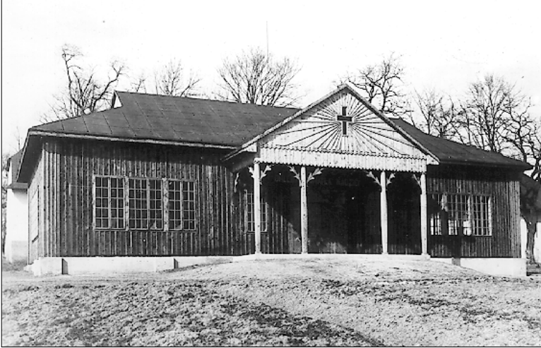
Pawilon przed przebudową

W latach 60-tych Diakonat i uczestnicy ruchu ewangelizacyjno-misyjnego przystosowali drewniany pawilon gospodarczy na kaplicę dla około 250 osób. I odtąd służyła ona zborowi i różno-