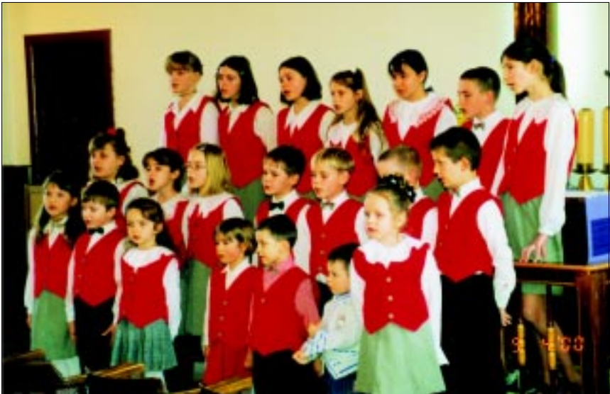
Chór dziecięcy „Junior”

„A tak, bracia moi mili, bądźcie stali, niewzruszeni, zawsze pełni zapału do pracy dla Pana, wiedząc, że trud wasz nie jest daremny w Panu”. (1 Kor 15,58)