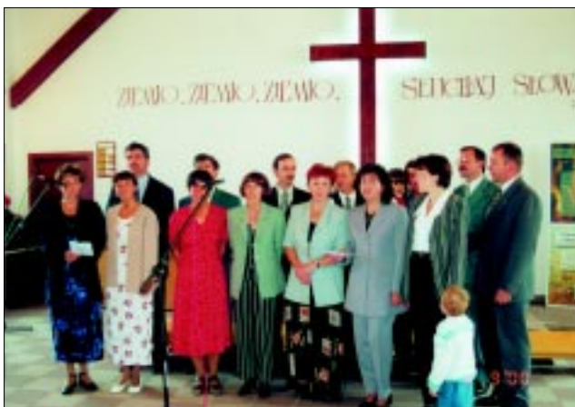
Grupa młodych małżeństw w Dziegielowie