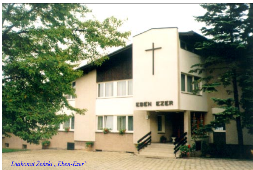
Diakoniat Żeński „Eben-Ezer”