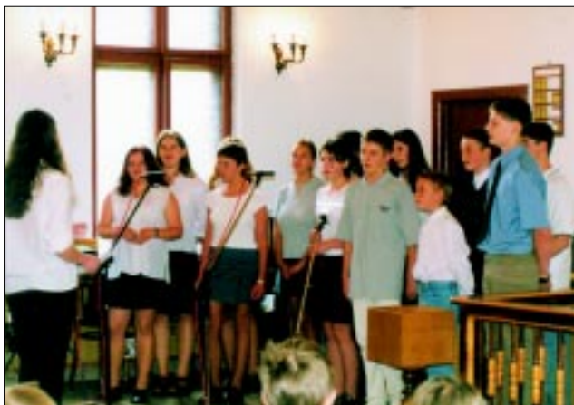
Zespół młodzieżowy Dziegielów-Puńców