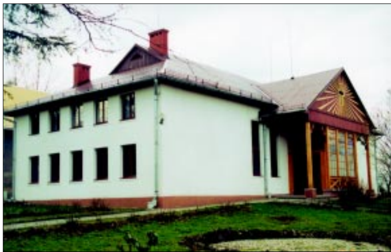
Kaplica zborowa „Eben-Ezer” w Dziegielowie po remoncie.

Nabożeństwa odbywają się w każdą niedzielę i święta, w kaplicy o godz. 10-tej i w Domu Opieki „Emaus” o godz 8.30.