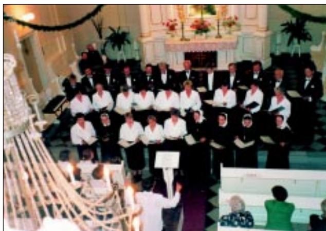
Chór z Dziegielowa na III Ewangelickich Dniach Kościoła w Pszczynie 2.08.1997 r.